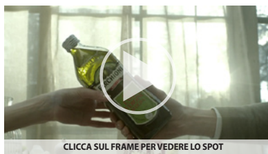
CLICCA SUL FRAME PER VEDERE LO SPOT