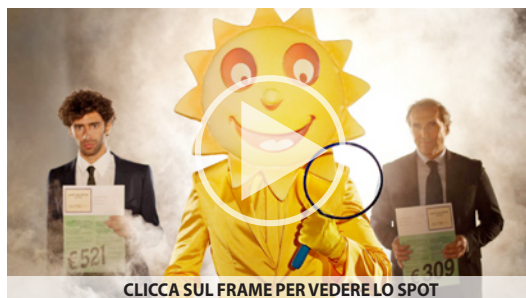
CLICCA SUL FRAME PER VEDERE LO SPOT

Il sito comparatore di assicurazioni presenta una nuova creatività e sceglie in forma diretta la centrale fondata da Claudio Bottini